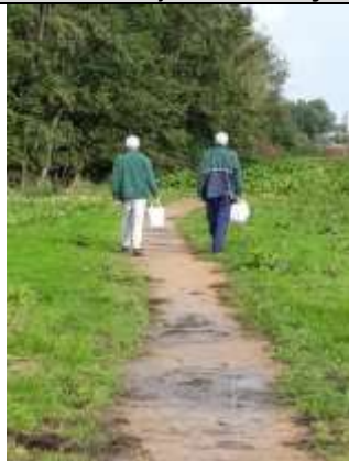
03/10, waterdieren zoeken.

Het was een heerlijke ontspannen bijeenkomst waarin we ons hebben verdiept in de schaatsenrijders. Het mannetje buiktandje heeft een klein maar duidelijk tandje aan de onderkant van het achterlijf(je).