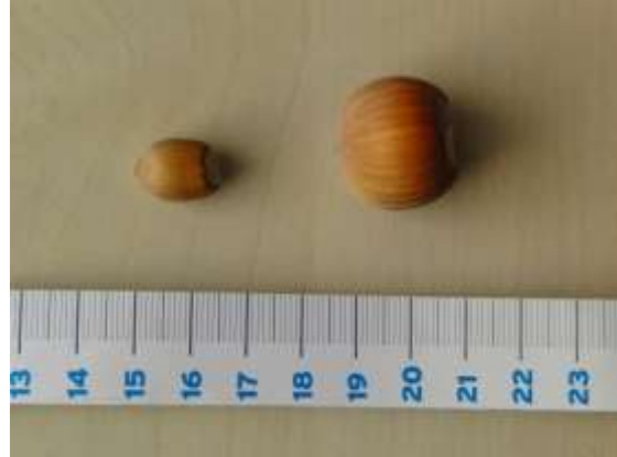
27/09, hazelnoten 2019, Aukje Gjaltema.