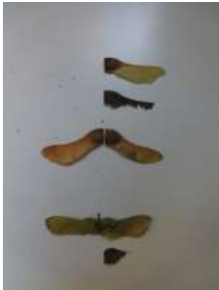
30/09, zadjes Noorse esdoorn (boven) en Spaanse aak (onder) , Aukje Gjaltema.

29/09, het is een goede hazelnoten jaar, en ik heb volop geraapt.