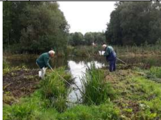
03 10, zilveren schaatsenrijders en buiktandjes gevonden, Overslagmolensloot.