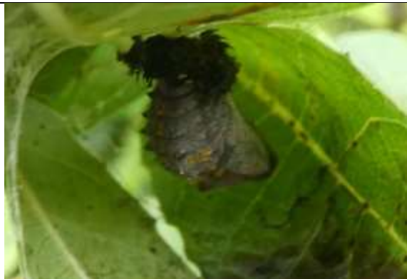
29/09, pop atalanta , Willemein Poot. 03/10, de pop is verdwenen