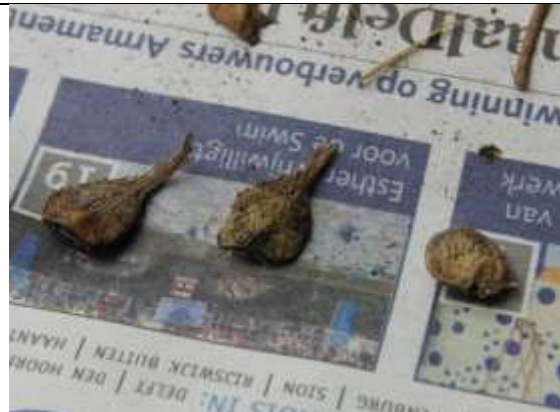
29/09, zaadjes parkje Nasserstraat, Delft, Aukje Gjaltema.