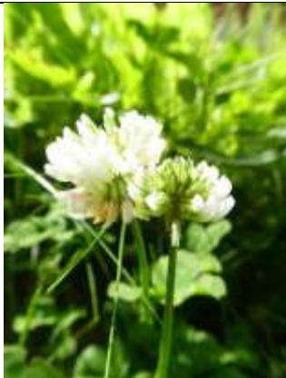
31/05, witte klaver , Den Hoorn, Willemein Poot.