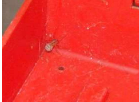
25,06/ getijgerde lijmspuit , keuken, Aukje Gjaltema.