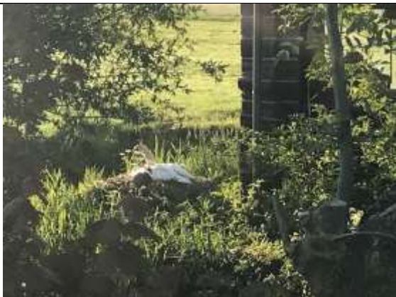
27/05, zwaan met jongen , Zuideindseweg Delfgauw, Karin Flier.