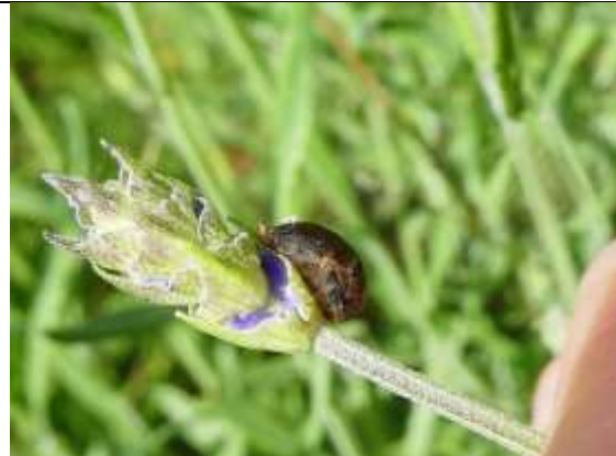
31/05, dezelfde nimf van rozemarijngoudhaantje als op de foto van 28/05, Den Hoorn, Willemein Poot.