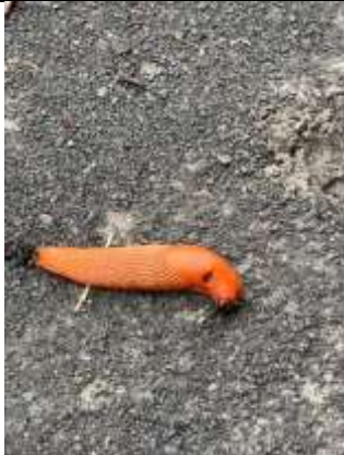
13/07, gewone wegslak , Anneke van Veen.

Als je geen account hebt mag je het melden via knndelft en zaterdag. Zet je naam in de toelichting.