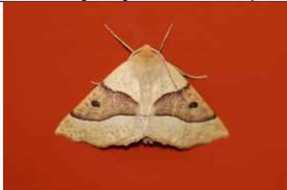
17/07, kortzuiger(crocallis elinguaris) , Delft, Jan van der Drift.