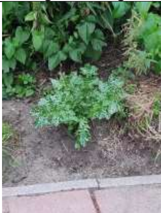
15/07, mariadistel , station Delft zuid, Peter Jacobs