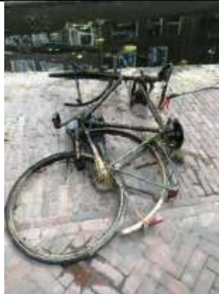
14/07, uit de gracht gevist, Bruun vd Steuijt