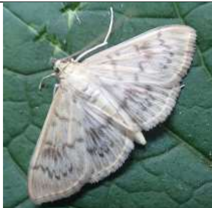
18/07, parelmoermot , Wezeltuon, Delft, Marian.