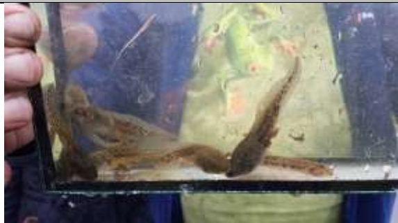
Groene kikkers (links), bittervoorn, rechts.