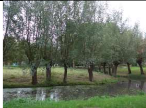
Boomgaard Chilipad 1

23/07, gesprek met bestuur Vereniging van Eigenaren (VVE) Chilipad 1 over natuurwaarden hoogstamboomgaard. Van het gesprek wordt een verslag gemaakt dat op de eerstvolgende VVE-ledenvergadering wordt besproken.