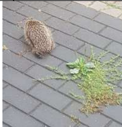
Egel met grote weegbree en varkensgras , Roy Matheusen