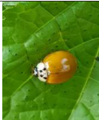
31/07, Aziatisch lieveheersbeestje , tuin Ems Zuidgeest.