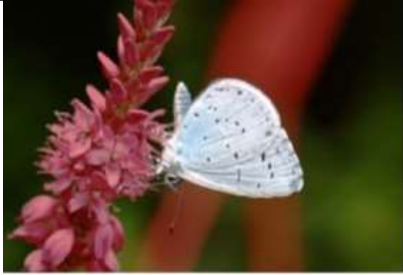
2/07, boomblauwtje , Marterstraat, Delft, Jan van der Drift.