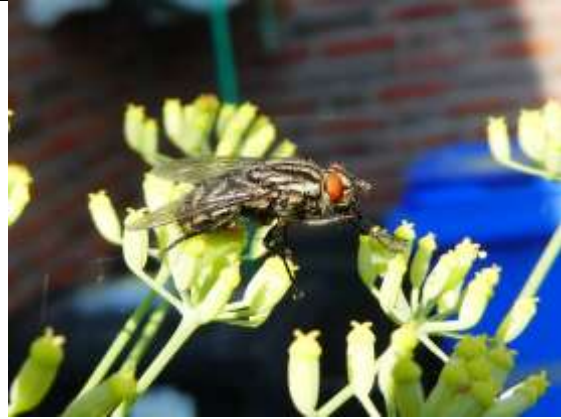
30/07, dambordvlieg , Den Hoorn, Willemein Poot.