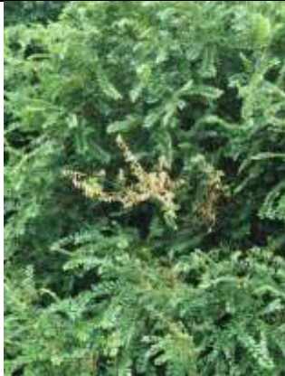
27/07, iepziekte , Abtswoudse bos, Aukje Gjaltema.