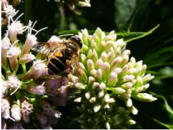
30/07, bosbijvlieg , Avifauna, Willemein Poot.