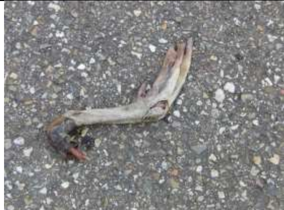
27 07, vogelpoot , Sint Maartensrechtpad, Aukje Gjaltema.