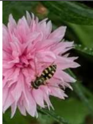
30/07, terraskommazweefvlieg , Den Hoorn, Willemein Poot.