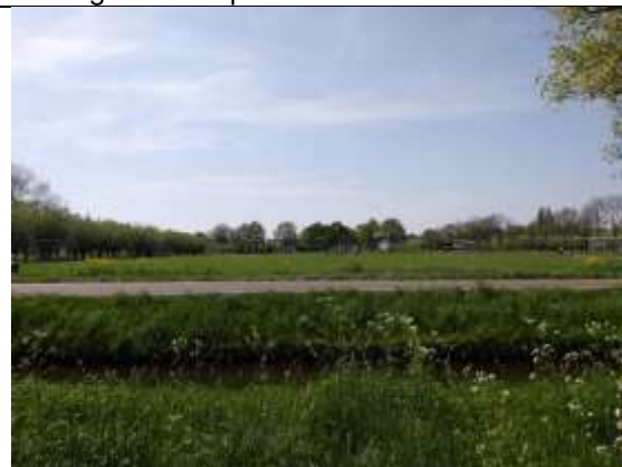
22/04, spelende kinderen in het Abtswoudsepark