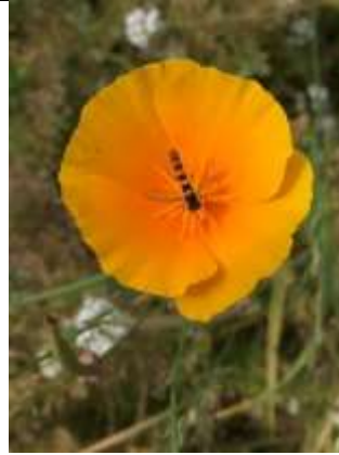
2/07, grote langlijf , Wulppad Delft, Betty Verheul.