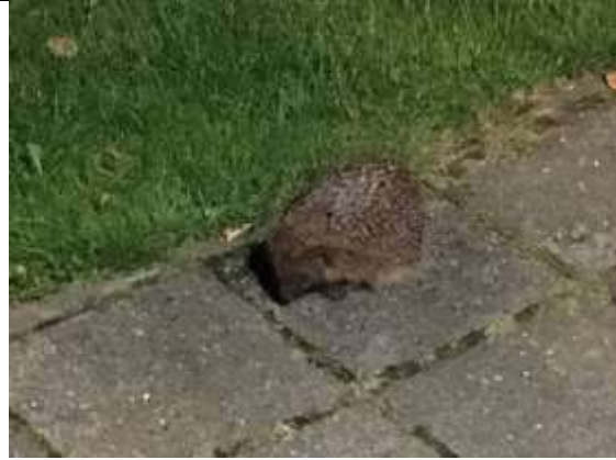
02/08, egel , Rommesingel 49 Pijnacker, C.C.H. Kayser.