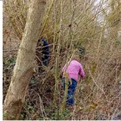
Knotters in het riet