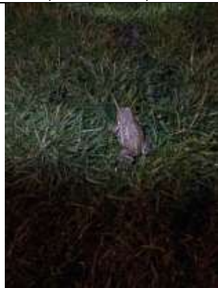
06/03, padden , Maasland, Marianne van Beusichem.

06/03, woensdagavond weer padden wezen overzetten in Maasland.