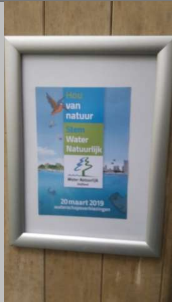
06/03, stemaffiche in het Melarium

KNNV-afdelingswinkel, bij KNNV uitgaven ontvangen leden 10% korting, bestel via afdelingDelfland@knnv.nl